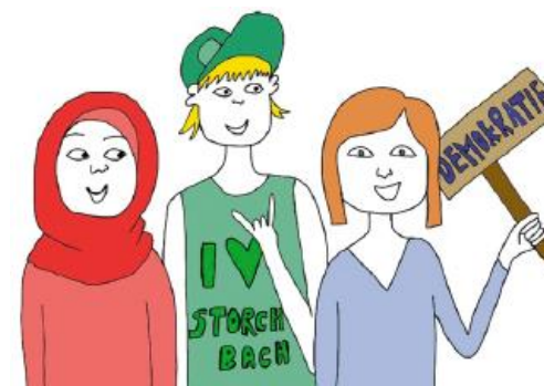
Zeichnung: Martina Peao LpB

Veranstaltungsort: Zwei Räume mit Tischen und Stühlen