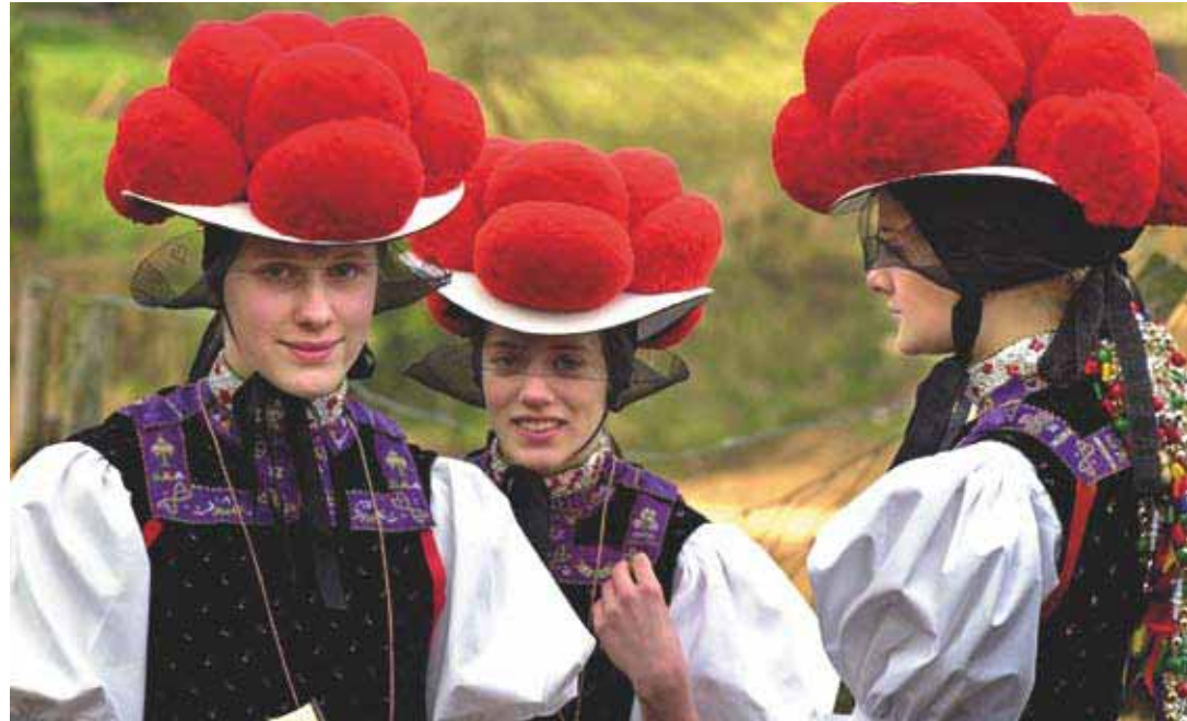
Der in mühevoller Handarbeit gefertigte Bollenhut mit zugehöriger traditioneller Tracht im Schwarzwald: Den roten Bollenhut dürfen die Mädchen erstmals bei der Konfirmation tragen, während verheiratete Frauen an Festtagen, bei Prozessionen und Brauchtumsveranstaltungen den schwarzen Bollenhut tragen.

Die außerordentlich bunte Kulturlandschaft des Südwestens ist das Produkt eines jahrhundertelangen Austausches zwischen Heimat und Ferne, zwischen Eigenem und Fremdem. Traditionen und Bräuche formen so das kulturelle Gedächtnis des Landes und sind Teil des täglichen Lebens. Heimatpflege ist insofern Pflege der vielfältigen Kulturlandschaft. Vor allem im ländlichen Raum dient sie aber auch dem Schutz und der Pflege der Landschaft und Natur. Jährlich rücken die immer an einem anderen Ort stattfindenden Heimattage Baden-Württemberg die Breite der lokalen Kultur des Landes in den Mittelpunkt des Interesses.