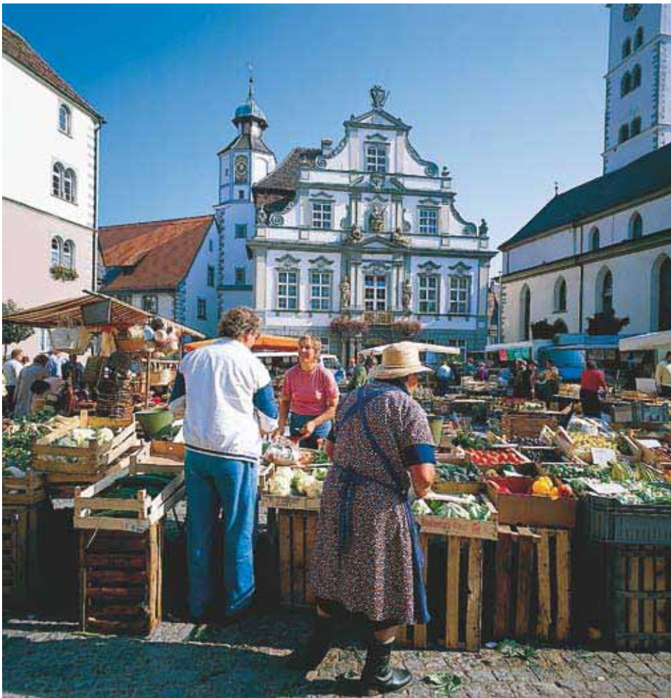
Das barocke Rathaus von Wangen im Allgäu.