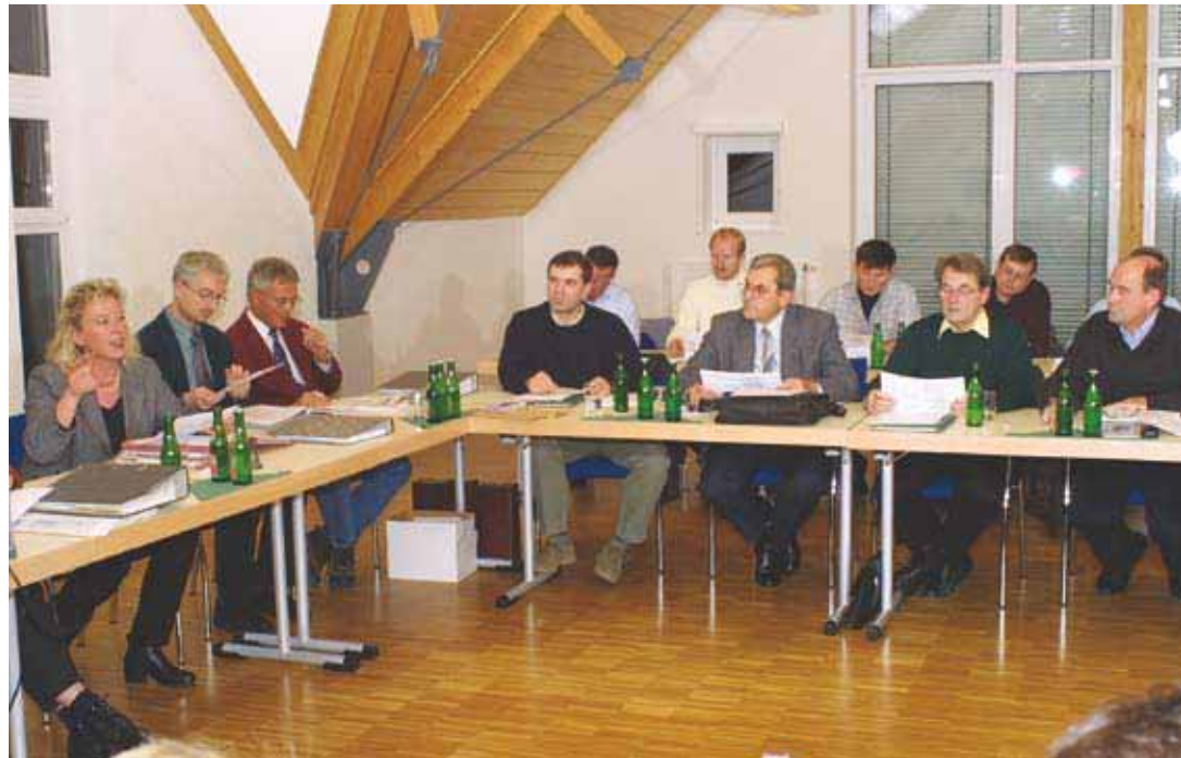
Gemeinderatssitzung in der Stadt Stühlingen im Südschwarzwald: eine der wenigen Gemeinden in Baden-Württemberg mit einer Bürgermeisterin.

Dem Gemeinderat obliegt zudem die Kontrolle der Gemeindeverwaltung. Die wichtigsten