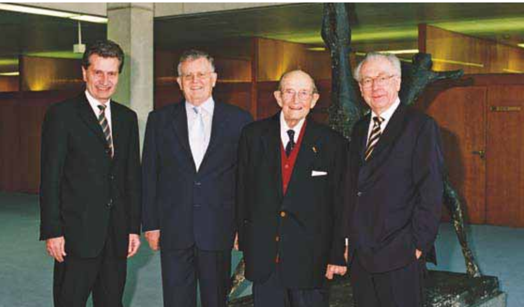
Der Ministerpräsident von Baden-Württemberg, Günther H. Oettinger (links), und seine drei Vorgänger (v. l. n. r.) Erwin Teufel, Hans Filbinger (gest. 2007) und Lothar Späth im Jahr 2006.