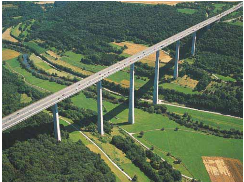
Die Infrastruktur des Landes ist ein wichtiger Faktor der Wettbewerbsfähigkeit Baden-Württembergs. Das Foto zeigt die Kochertalbrücke bei Braunsbach-Geislingen in der Nähe von Schwäbisch Hall, die höchste Autobahnbrücke Deutschlands.

Ressourcen ausgerichtete Siedlungs- und Freiraumentwicklung, die die gesellschaftlichen und wirtschaftlichen Ansprüche an den Raum mit seinen ökologischen Funktionen in Einklang bringt und das Land als europäischen Lebens-, Kultur- und Wirtschaftsraum stärkt. In Ergänzung dazu lässt sich auch die Nachhaltigkeitsstrategie Baden-Württemberg ver-