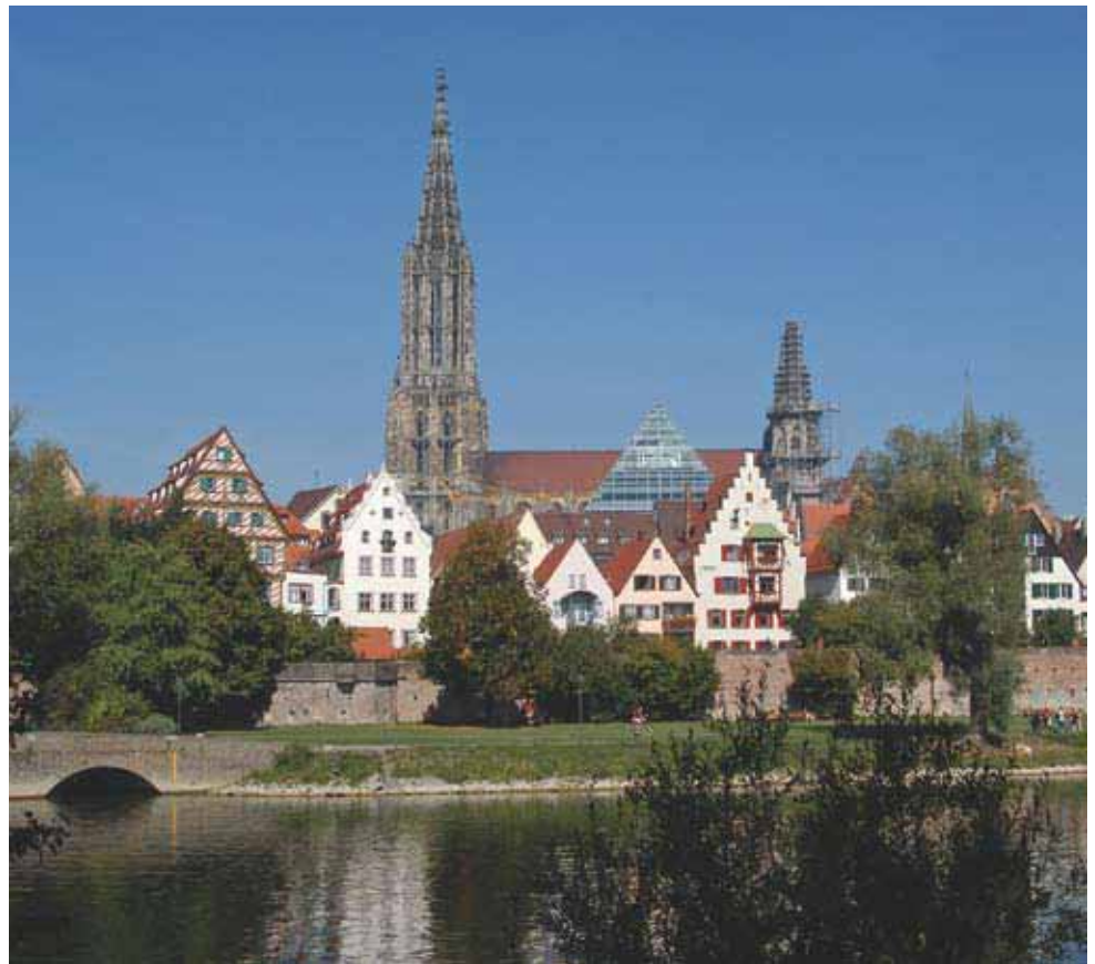
Den höchsten Kirchturm der Welt (161 m) hat das Münster der alten Reichsstadt Ulm an der Donau, im 17. und 18. Jahrhundert ständiger Tagungsort des Schwäbischen Reichskreises.

Anders als andere Bundesländer, namentlich Nordrhein-Westfalen (18 Mio. Einwohner, nur noch 396 Gemeinden), ist Baden-Württemberg nach wie vor ein Land der kleinen und mittleren Gemeinden geblieben. Nur vier Städte im Land haben mehr als 200.000 Einwohner: Stuttgart (593.000), Mannheim (308.000), Karlsruhe (285.000) und Freiburg im Breisgau (216.000). Fünf weitere Städte haben über 100.000 Einwohner: Heidelberg (143.000), Heilbronn (122.000), Ulm (121.000), Pforzheim (119.000) sowie Reutlingen (112.000). 89 Gemeinden haben den Rechtstitel „Große Kreisstadt“, mit einer Einwohnerzahl zwischen 20.000 und 100.000; auch ihr Stadtoberhaupt darf sich Oberbürgermeister nennen. Demgegenüber hat die Hälfte aller Gemeinden im Land (53 %) nur bis zu 5.000 Einwohner. 311 baden-württembergische Gemeinden dürfen den Titel „Stadt“ tragen.