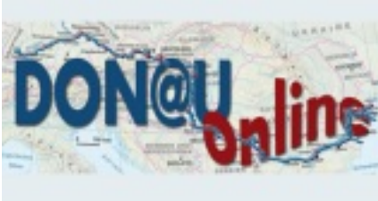
( http://www.donau-online-projekt.de )

Politische Tage der LpB (/politische-tage)