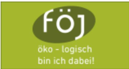
( https://www.foej-bw.de )

Infos unter: www.donau-online-projekt.de ( http://www.donau-online-projekt.de )