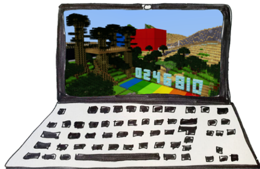
Zeichnung: Angelika Barth