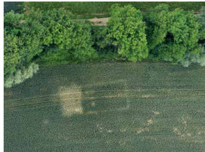
Bad Friedrichshall-Kochendorf: Fundamente einer ehemaligen KZ-Baracke im Luftbild