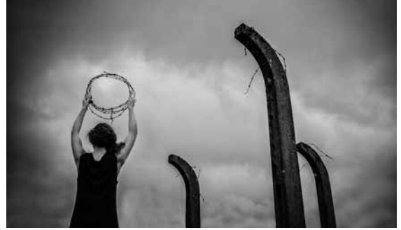
Jakub Bak, Sibilla-Egen-Schule Schwäbisch Hall