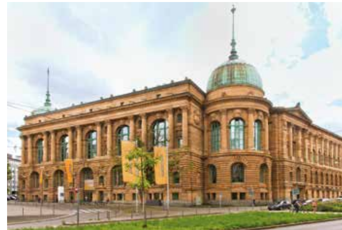
Haus der Wirtschaft Baden-Württemberg

https://wm.baden-wuerttemberg.de/natzweiler bereitgestellt.