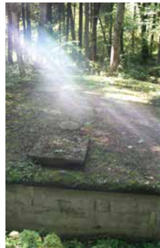
Gedenkstätte Eckerwald: Sina Fleig, Gymnasium Gosheim-Wehingen