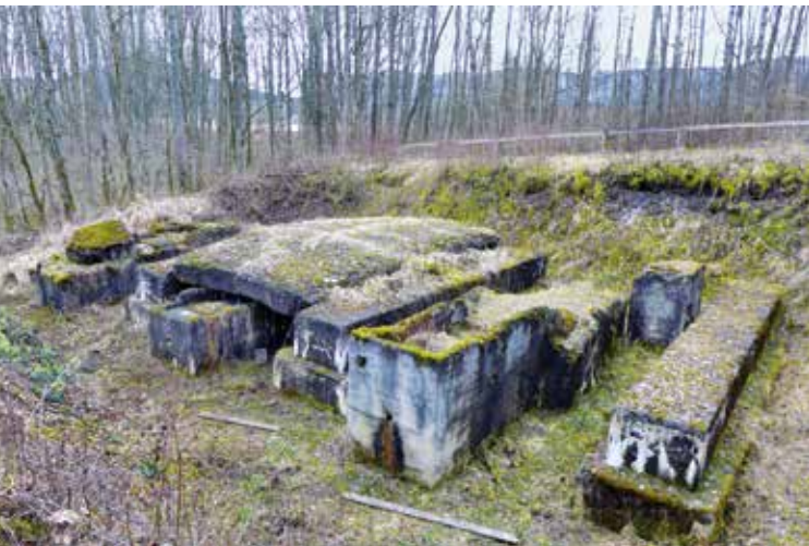
Bispingen: Industrieruinen des Schieferöls „Wüste 2“

Dans le Bade-Wurtemberg, certains vestiges des camps annexes de Natzweiler sont d'ores et déjà protégés au titre des Monuments historiques. Dans le cadre d'un projet de recherche de quatre ans qui a été lancé au sein de l'Office régional des monuments historiques du Bade Wurtemberg, ces vestiges font désormais l'objet d'intenses travaux d'études. Parallèlement, des recherches sont également effectuées depuis les airs, au sol et dans les centres d'archives afin d'exhumer d'autres traces de l'oubli. Les fouilles archéologiques qui ont cours s'appuient sur les techniques et méthodes les plus modernes.