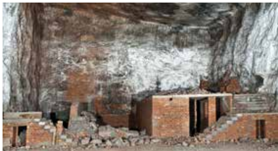
Salzbergwerk Bad Friedrichshall-Kochendorf: Ehemalige Rüstungsfabrik „Eisbär“, Miklos-Klein-Stiftung

E-Mail: nicola.geldmacher@rps.bwl.de Rückfragen unter Telefon: +49 (0)711-90 44 51 02