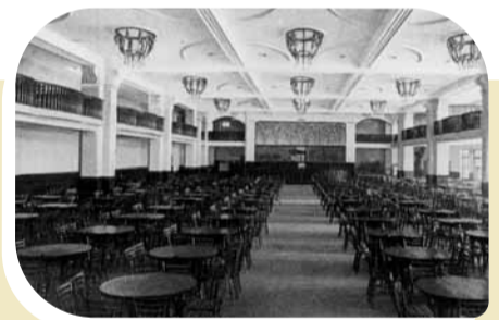
Der Saal des Bürgerbräukellers