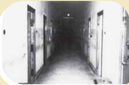
Zellengang im „Kommandanturarrrest“ des Konzentrationslagers Dachau.

Anfang 1945, vermutlich im Februar, überführt die Gestapo Georg Elser in das KZ Dachau. Er wird schwer bewacht im Zellenbau des Lagers in Einzelhaft. Auch in Dachau erhält Elser eine Hobelbank und kann auf seiner Zither spielen. Georg Elser ahnt wohl, dass er das Kriegsende nicht erleben wird. Mehrfach soll er darüber seine Besorgnis geäußert haben.