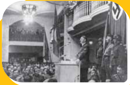
Adolf Hitler bei der Rede im Bürgerbräukeller. München, 8. November 1939.

Hitler will zunächst, wegen des Krieges und des unmittelbar bevorstehenden Angriffs deutscher Truppen im Westen erstmals bei den Feierlichkeiten zum Jahrestag des Hitlerputsches nicht selbst reden. Nur sein Stellvertreter Rudolf Heß soll sprechen. Hitler entschließt sich jedoch kurzfristig, diese Gelegenheit selbst für eine grundsätzliche Rede zu nutzen. Er spricht erheblich kürzer als bei früheren Feiern, weil er unmittelbar danach wieder nach Berlin zurückkehren muss.