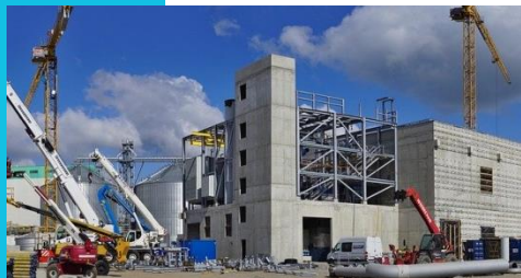
Größere Bauprojekte für Renovierungen und Neubauten von Wohnungen.

Aufgabe: Ordne die Bilder mit den entsprechenden Bezeichnungen, den vier Phasen zu. Kleiner Tipp: Immer zwei Bilder können einer Phase zugeordnet werden.