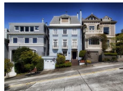
Wohnungen stehen leer.