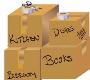
Frühere Bewohner können sich die Miete nicht leisten und werden verdrängt.