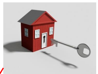
Mehr Menschen interessieren sich für die Wohnungen im Stadtteil.