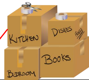
Frühere Bewohner können sich die Miete nicht leisten und werden verdrängt.