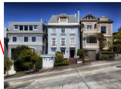
Wohnungen stehen leer.