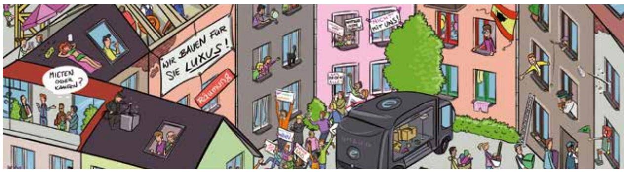
■ WG: Wohngemeinschaft. Gruppe von Personen, die gemeinsam in einem Haus oder einer Wohnung leben.

Der Zuschuss soll es Familien mit Kindern sowie Alleinerziehenden leichter machen, ein eigenes Haus oder eine Eigentumswohnung zu finanzieren. Um Geld zu sparen, teile ich mir mit zwei anderen Personen eine 3-Zimmer-Wohnung. Wir teilen uns die Küche und das Bad. Jeder hat ein eigenes Zimmer. Die Stadt baut Wohnungen und vermietet sie günstig an sozial Schwache.