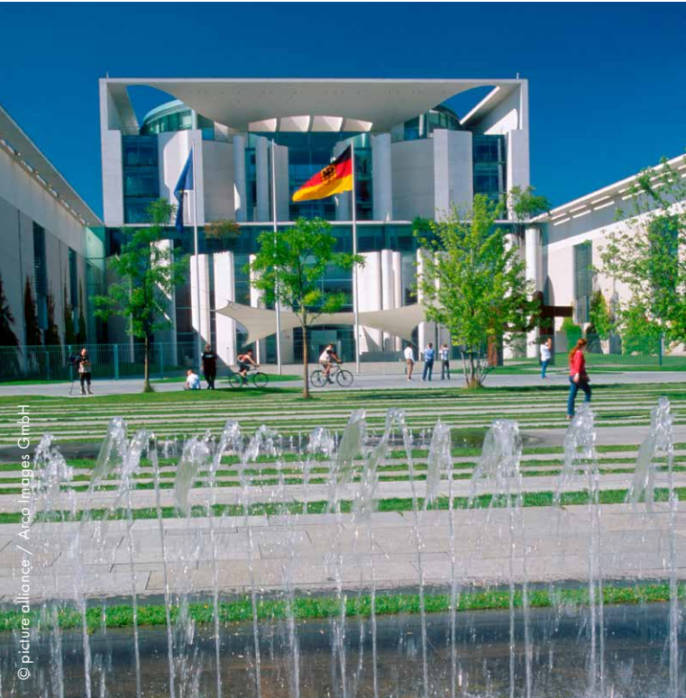
Das Bundeskanzleramt in Berlin

Friedrich Merz ist der Bundeskanzler der Bundesrepublik Deutschland. Er ist so wie der Kapitän auf einem Schiff. Er entscheidet zum Beispiel, was sich in Deutschland verändern soll. Dabei helfen ihm die Ministerinnen und Minister. Der Bundeskanzler und seine Ministerinnen und Minister arbeiten in der Bundesregierung zusammen.