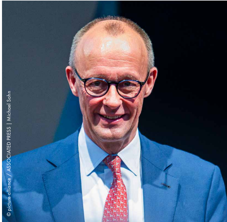
Bundeskanzler Friedrich Merz