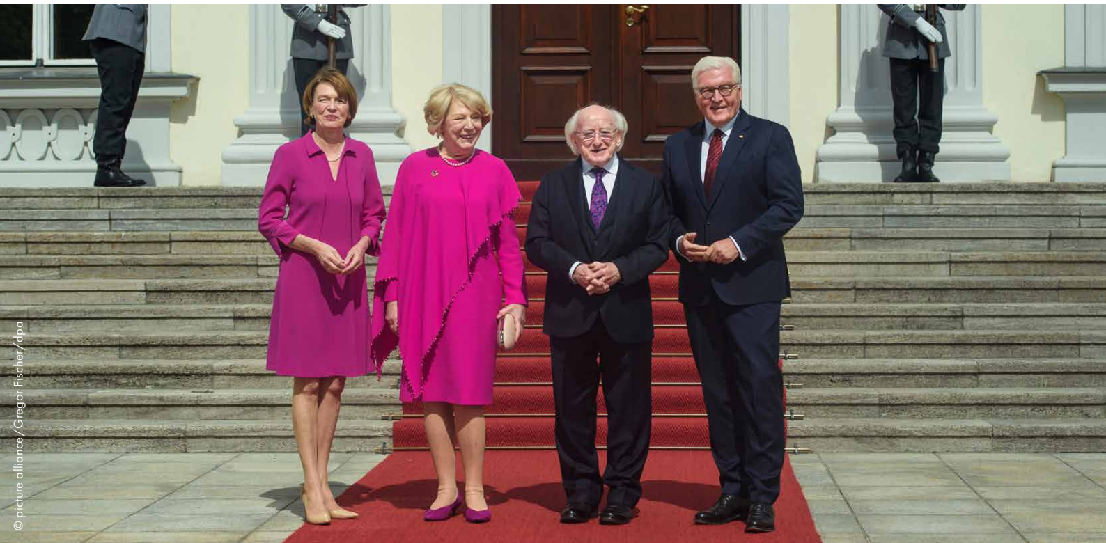
Bundespräsident Frank-Walter Steinmeier und seine Ehefrau mit Gästen aus dem Ausland

Frank-Walter Steinmeier ist der Bundespräsident der Bundesrepublik Deutschland. Er arbeitet im Schloss Bellevue in Berlin und ist das Staatsoberhaupt. Er ist aber nicht der Chef von Friedrich Merz, dem Bundeskanzler. Der Bundespräsident repräsentiert Deutschland .