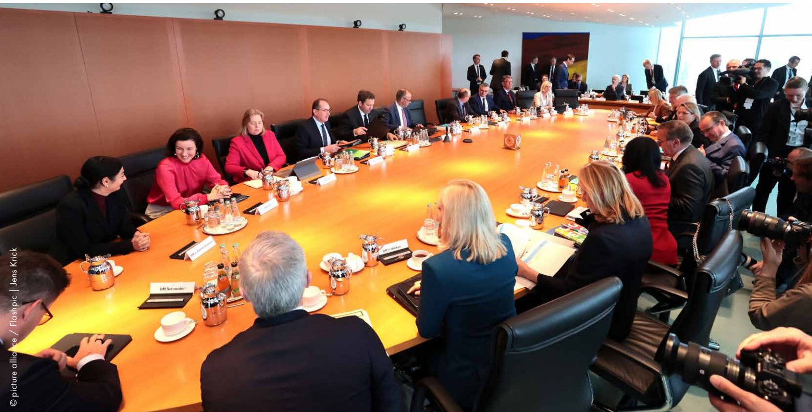
Die Bundesregierung: Der Bundeskanzler und seine Ministerinnen und Minister