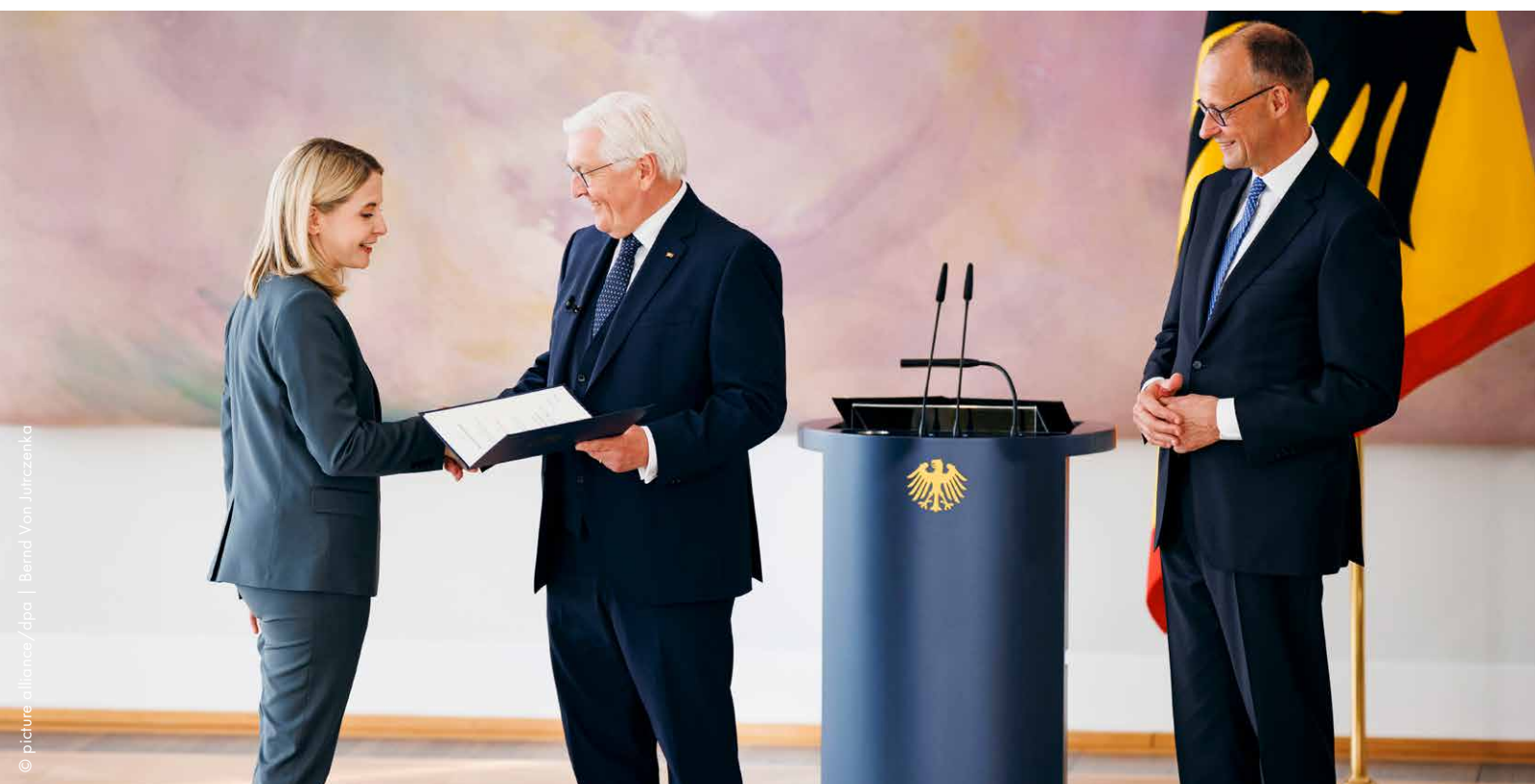
Frank-Walter Steinmeier ernennt Verena Hubertz zur Bundesministerin für Wohnen, Stadtentwicklung und Bauwesen. Sie arbeitet in der Regierung von Bundeskanzler Friedrich Merz.