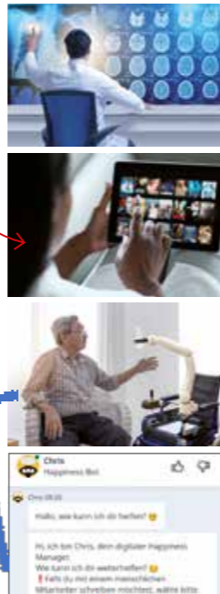
Bilder links: v. o. n. u.: Suwin, Golden Dayz, aapp, Sasha Bullett/shutterstock.com Bilder rechts: v. o. n. u.: Elnur, Diego Cervo, PaO_STUDIO/shutterstock.com

Die Wissenschaft arbeitet seit vielen Jahren daran, die menschliche Wahrnehmung und das menschliche Handeln durch Maschinen nachzubilden. Das Ziel ist künstliche Intelligenz. Maschinen sollen eigenständig Probleme lösen, Entscheidungen treffen und mit Menschen kommunizieren . Der Mensch programmiert die Arbeitsschritte und Anweisungen , die die Maschine befolgen soll. Ein selbstfahrendes Auto muss erst lernen, wie es sich im Straßenverkehr richtig verhält. Es lernt auch, in unvorhergesehenen Situationen schnell zu reagieren, zum Beispiel wenn ein anderes Auto plötzlich abbremst.