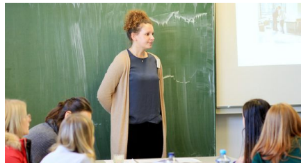
Politische Tage im Esslinger Landratsamt.

Wie gelingt Demokratiebildung im Unterricht und in der Schule? Diese Seite gibt einen Überblick für Lehrkräfte, welche Materialien und Angebote sie zur Demokratiebildung nutzen können. Viele Organisationen und Institutionen bieten in Baden-Württemberg demokratiebildende Projekte für einzelne Fächer, Klassen und Schulen an. Außerdem liefern die Fächersteckbriefe zur Demokratiebildung konkrete Vorschläge, wie Demokratiebildung auch in Fächern wie Geographie, Deutsch oder im Sprachunterricht implementiert werden kann.