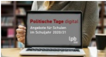
Online lernen. Foto: Gerd Altmann, Pixabay.com, 3653428

Die weltweite Corona-Pandemie hat das Leben der Menschen in vielen Staaten verändert. Auch in Deutschland wurden durch gezielte Maßnahmen zur Eindämmung der Pandemie Grundrechte eingeschränkt. In den Bundesländern wurden beispielsweise Schulen, Kindergärten und Kindertagesstätten geschlossen und schrittweise erst wieder geöffnet.