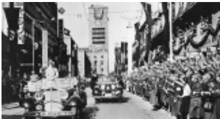
Stuttgart: Königsstraße 1938.