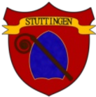
Das Wappen der Stadt Stuttingen